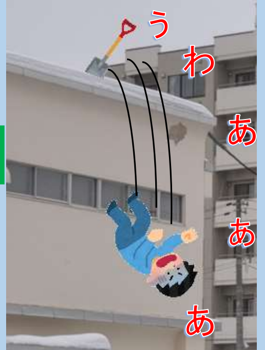
雪下ろし中の墜落