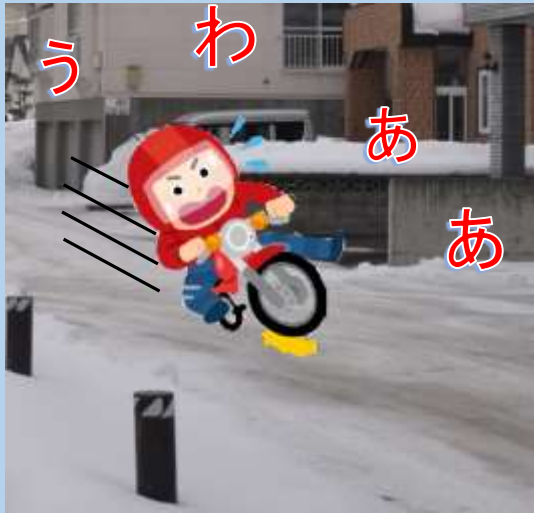
凍結路面での交通事故