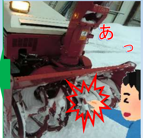
除雪機の刃部との接触