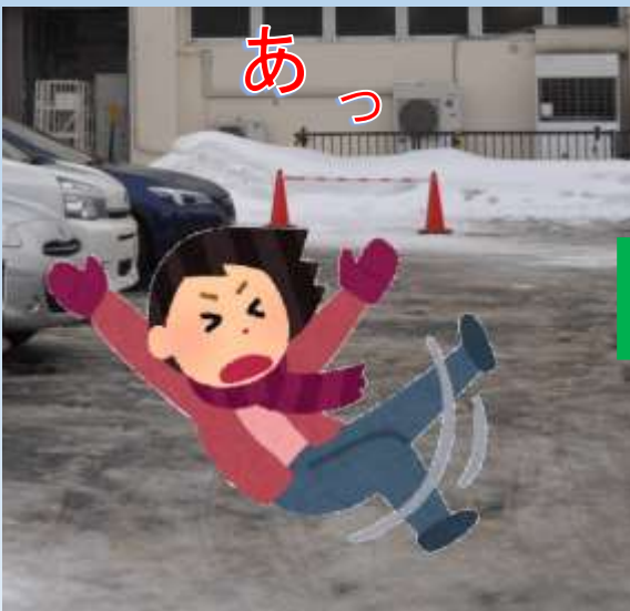
積雪・凍結路面での転倒